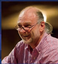
演出:ペーター・コンヴィチュニー Stage Director: Peter Konwitschny