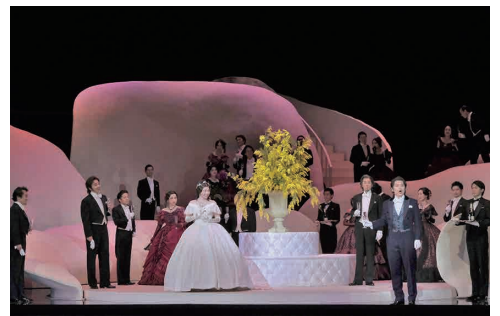
2020年2月東京公演より

再演演出 澤田康子 振付 麻咲梨乃 装置 松井るみ 原演出 原田 諒 衣裳 前田文子 合唱指揮 佐藤 宏 照明 喜多村貴 舞台監督 村田健輔