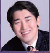
指揮: 原田慶太楼 Conductor: Keitaro Harada