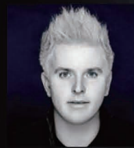
指揮：ダン・エッティンガー Conductor: Dan Ettinger

苦しみを乗り越えて、レオノーレの愛と勇気が歓喜を導く！ 東京二期会初登場となるダン・エッティンガーの指揮、 『ダナエの愛』(2015)、『ローエン格林』(2018)に続き、オペラ三作目となる 映画監督・深作健太の演出で贈る、ベートーヴェンの記念碑的オペラ！