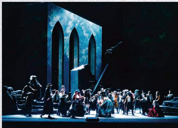
シラー処女作による、ヴェルディ11作目のオペラ『郡盗』より。自由への願望、権力への反抗を表現した作品です。