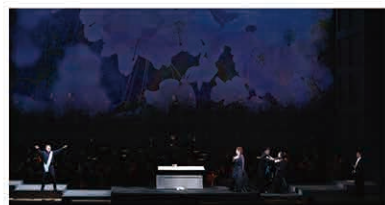
2022年東京二期会コンチェルタンテ・シリーズ「エドガール」

ゼンパーオーバー・ドレスデン、 デンマーク王立歌劇場、 サンフランシスコ歌劇場との共同制作 プッチーニ『蝶々夫人』 オペラ全3幕 日本語字幕付原語(イタリア語)上演 指揮:ダン・エッティンガー 演出:宮本亞門 合唱:二期会合唱団 管弦楽:東京フィルハーモニー交響楽団 東京 2024年7月18日(木) 18:30、19日(金) 14:00 20日(土) 14:00、21日(日) 14:00