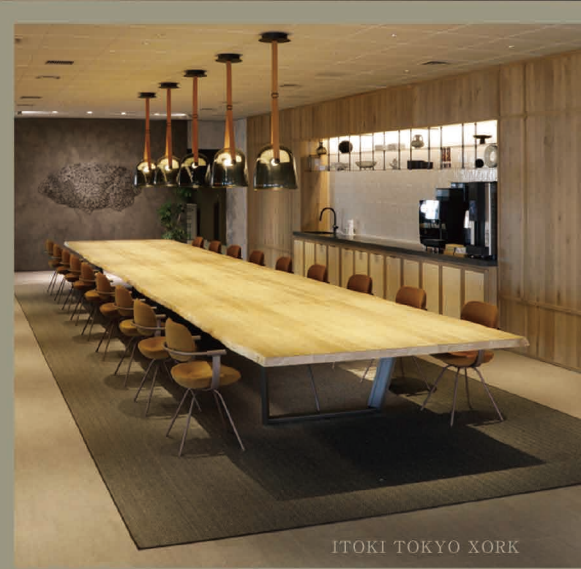
ITOKI TOKYO XORK

お客様の Well-being を実現するオフィスをご提案します。 ホームオフィス、在宅テレワークの環境づくりもお任せください。