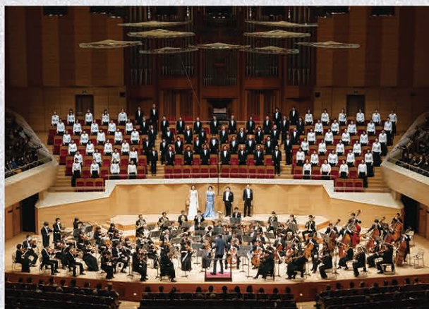
詩人としても知られるシラーの詩はベーターヴェン『第九』の『歓喜の歌』に。2022年12月の新日本フィル、二期会合唱団の舞台より。