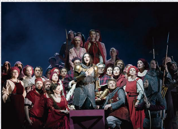
ジャンヌ・ダルクを描いた、チャイコフスキー作曲『オルレ안의処女』。演出は、『ドン・カルロ』と同じくロッテ・デ・ベア。Die Jungfrau von Orleans, Theater an der Wien 2019.