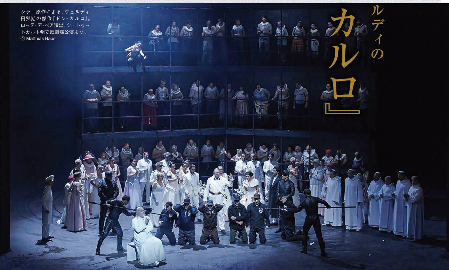
シラー原作による、ヴェルディ円熟期の傑作『ドン・カルロ』。ロッテ・デ・ベア演出、シュトゥットガルト州立歌劇場公演より。

一方、カルロを慕うエポリ公女は、思いがけない出来事からカルロの本心を知ってしまう。エリザベッタへの嫉妬を燃えあがらせ、彼女を陥れる。さらに、カルロを救おうとしたロドリゴは宗教裁判長の刺客により殺害される。ロドリゴの身代わりによって解放されたカルロは、フランスへ向かう前にエリザベッタに別れを告げる。そこへ国王と宗教裁判長が現れ、2人を逮捕しようとするが、前王カルロV世の霊声が響き渡り、カルロは前王の霊廟に引き込まれていく。