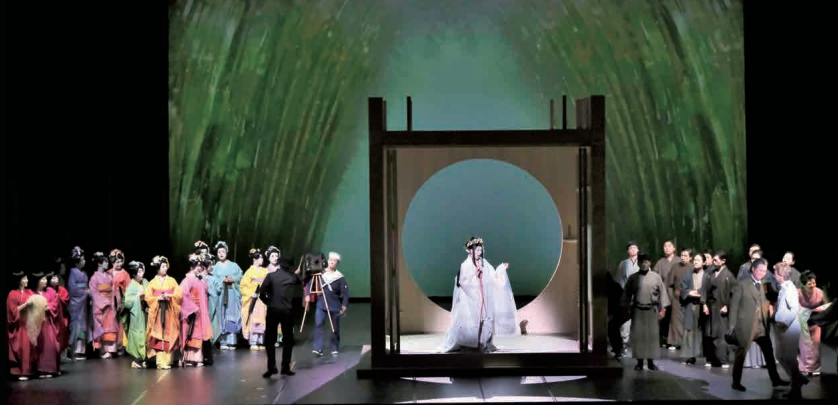
2019年東京二期会公演より

◆ 宮本亜門は、プッチーニが楽譜に残した複雑な舞台や映画的な性質を魅力的に浮き彫りにした。(Opera Warhorses) ◆ 高田賢三氏がデザインした女声合唱たちの衣裳はとて煌びやかだった。(オペラ・トゥーデイ) ◆ これほど生き生きとした『蝶々夫人』を観たのは初めてだった。 宮本亜門は、この物語をほとんど崇高なものにすることに成功した。これは決して小さからぬ成果だ。(フステージ&シネマ)