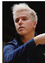
指揮 ダン・エッティンガー

装置: ボリス・クドルチカ 照明: 喜多村 貴 映像: バルテック・マシス 美粧: 柘植伊佐夫 合唱指揮: 糸原裕介 演出助手: 澤田康子、彌六 舞台監督: 村田健輔 公演監督: 永井和子 公演監督補: 大野徹也