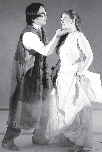
2008年 ドイツ・ポツダム/サン＝スーン国際音楽祭 カヴァーリ作曲『ラ・ロジнда』公演

オペラ」のチーフ音楽スタッフを務め、世界的な指揮者や歌手の厚い信頼を得る。国内外のコンクール、音楽祭、マスタークラスに招かれるほか、声楽のリサイタルやコンサートでも活躍。サントリーホールオペラ・アカデミーコーチング・ファカルティ。