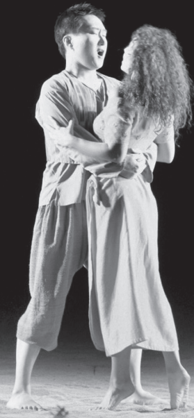
2004年 イタリア・クレモナ/モンテヴェルディ音楽祭 モンテヴェルディ作曲『ウリッセの帰還』公演