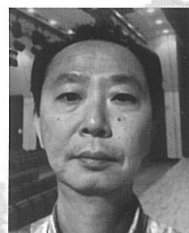
茨木 基 照明