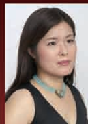
宮崎 恵美子 Soprano