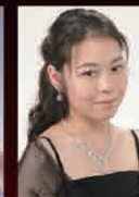
平野 真理子 Soprano